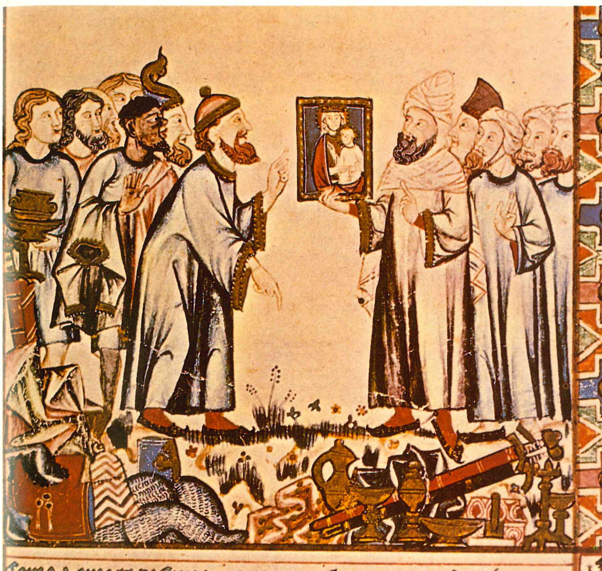
Moros y judíos en la Castilla bajomedieval (miniatura de Las Cantigas, Biblioteca de El Escorial)

ble por recuperarla. Un buen ejemplo es el de Palencia, que al comenzar la tercera década del siglo xv perdió la voz, y para recuperarla enviaba a la corte a sus procuradores, que a veces pasaban en ella varios meses tratando de conseguir el favor real.