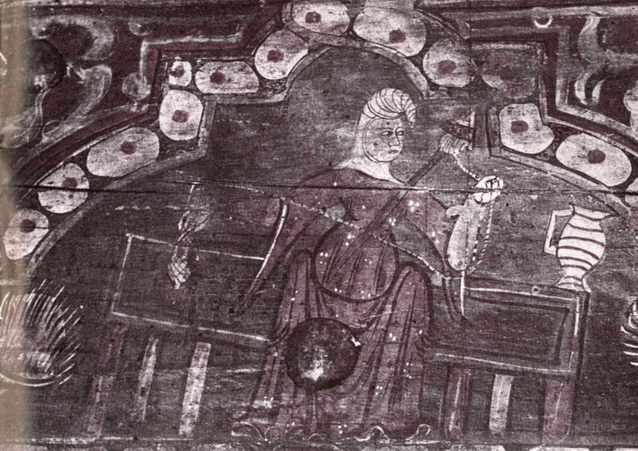
Hilanderá medieval castellana (fresco del claustro de Santo Domingo de Silos, Burgos)

para cumplir sus obligaciones espirituales de diversa índole: misas dominicales, confesión y comunión anual, procesiones festivas, bautizos, bodas y funerales. Pero, al mismo tiempo, el ciudadano era miembro de otra organización eclesiástica: la cofradía, organizada en ocasiones por la propia parroquia.