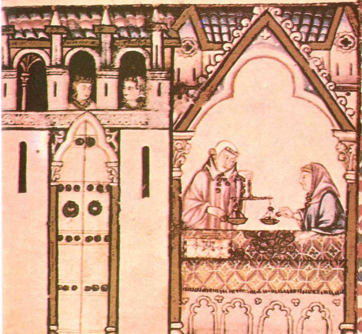
El despacho de un prestamista y cambista en el siglo XIII (miniatura de Las Cantigas de Alfonso X, Monasterio de El Escorial)

Como un cambiator aq'visiã çarin estaua en sa rede cambiator.