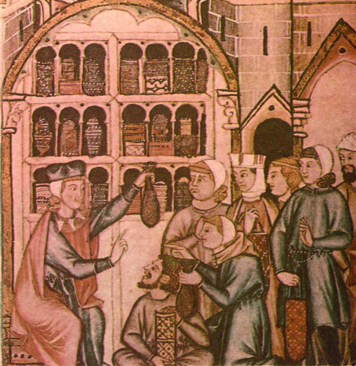
La consulta del médico en la Castilla medieval (miniatura de Las Cantigas de Alfonso X el Sabio, Monasterio de El Escorial, Madrid)

la Puente —, otro de los elementos del paisaje urbano cuidado especialmente por el Concejo; los gastos de su conservación eran a veces elevados, dedicándose para ello partidas importantes de dinero.