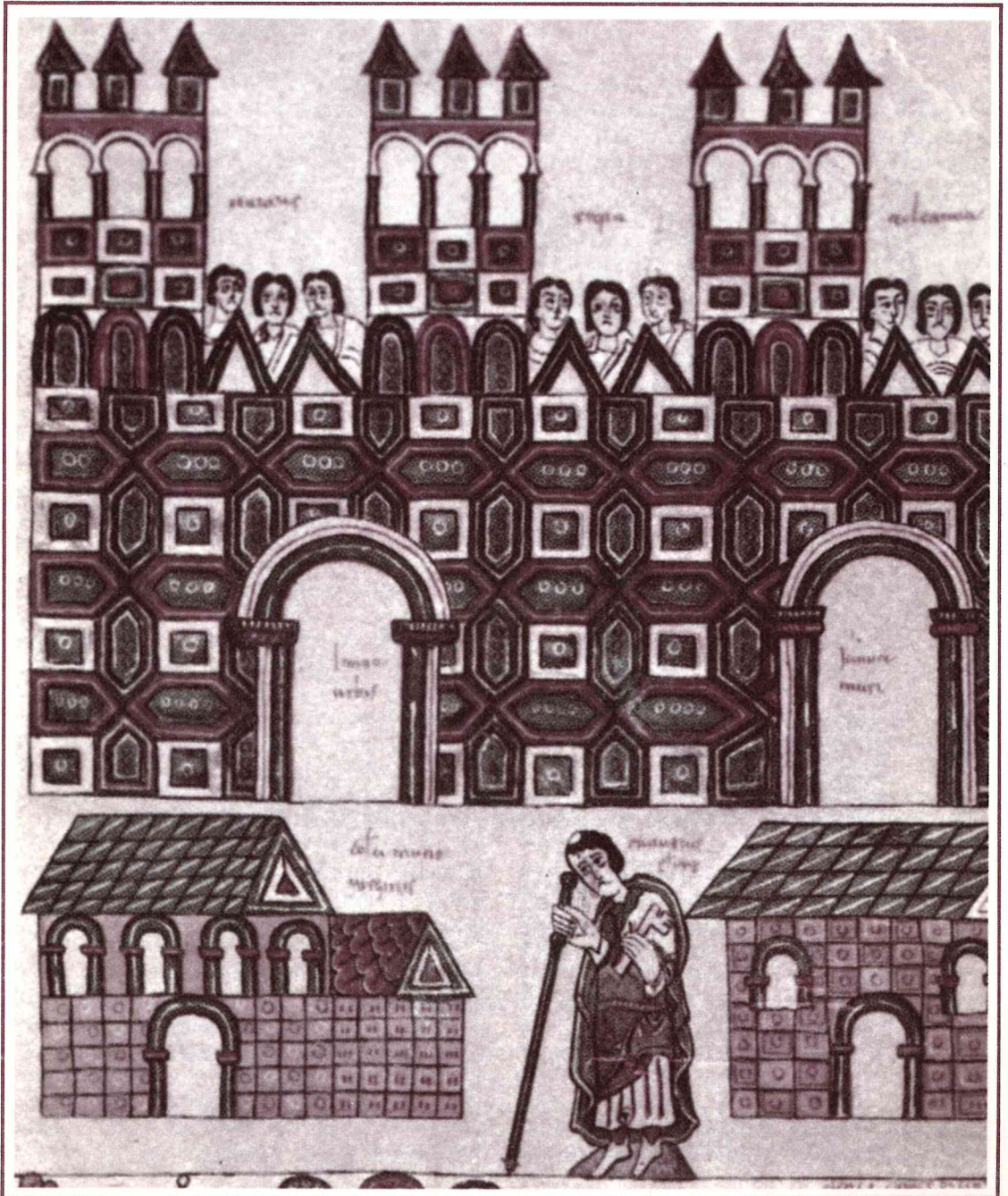
La ciudad de Toledo y las iglesias de Santa María y de San Pedro (detalle de una miniatura del siglo X, del Códice Conciliar de Albelda, Navarra)

El interior del recinto era de extensión variable, desde las 40 hectáreas de León o 45 de Burgos, a las 100 de Soria, 110 de Salamanca o 150 de Valladolid. A pesar de ello, estos recintos eran pequeños en comparación con los de otras ciudades europeas (París 273 Ha, Bru-