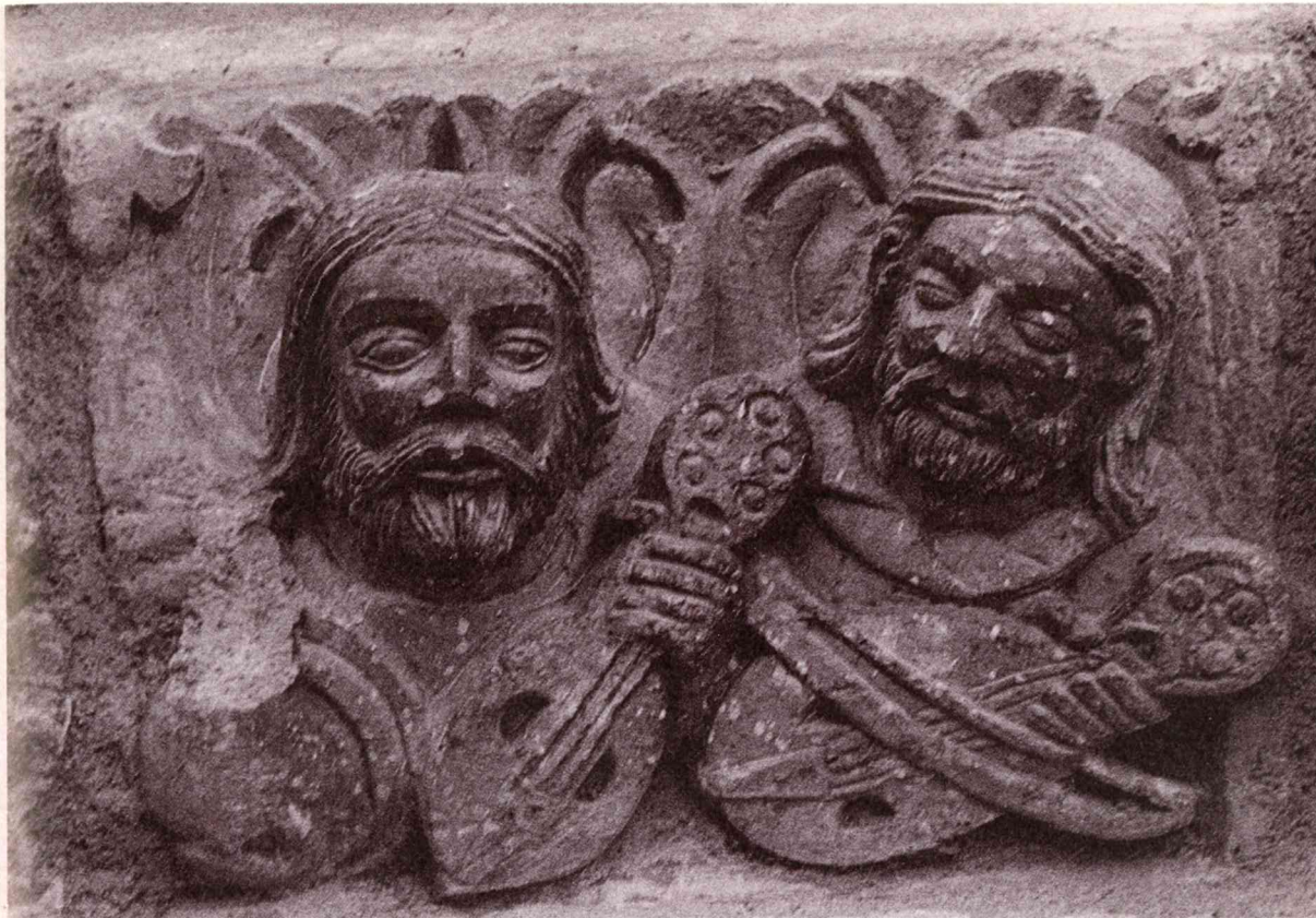
Músicos medievales (relieve en una de las puertas de Santa María de Piasca, Cantabria)

Este monarca, en este mismo año, aplicó esa orden para León y Segovia, y en años sucesivos el sistema del regimiento se extendió a buena parte de las ciudades de Castilla y León. Pero el regimiento no sólo se encuentra en las ciudades de realengo; por ejemplo, Palencia, ciudad de señorío episcopal, se rige por el mismo sistema. La medida de Alfonso XI probablemente no hizo más que confirmar lo que la costumbre había establecido: que las familias más poderosas tuvieran en sus manos el gobierno ciudadano. Pero al mismo tiempo, esa medida limitaba la autonomía municipal, pues al rey le era más fácil de esta manera el control de la vida local. Ese control o mediatización estaba en la mente de Alfonso XI, que tres años después de la institución del regimiento burgalés, afirma su intervención en los problemas de la justicia ciudadana creando la figura del corregidor.