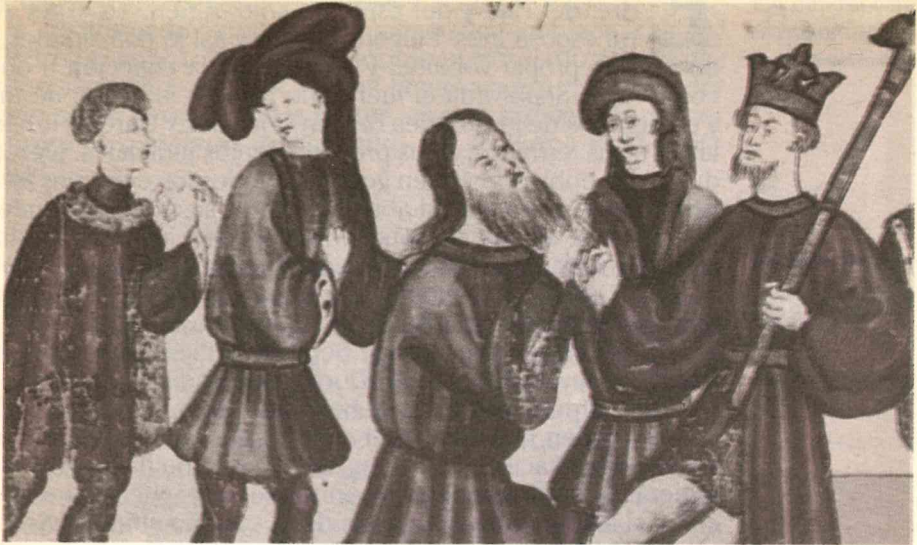
El juicio real (miniatura del libro Castigos e documentos, atribuido a Sancho IV el Bravo, finales del siglo XIII)