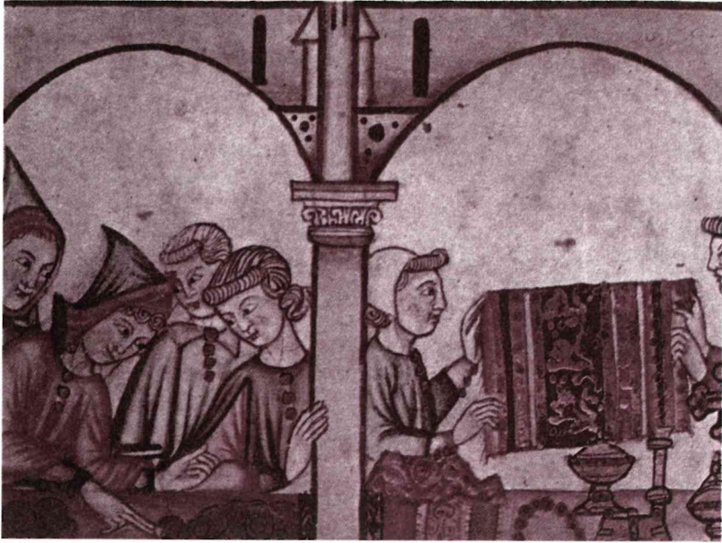
Un grupo de mujeres comprando alfombras, hilos de seda y joyas en una tienda castellana del siglo XIII (miniatura de Las Cantigas, de Alfonso X, Monasterio de El Escorial)