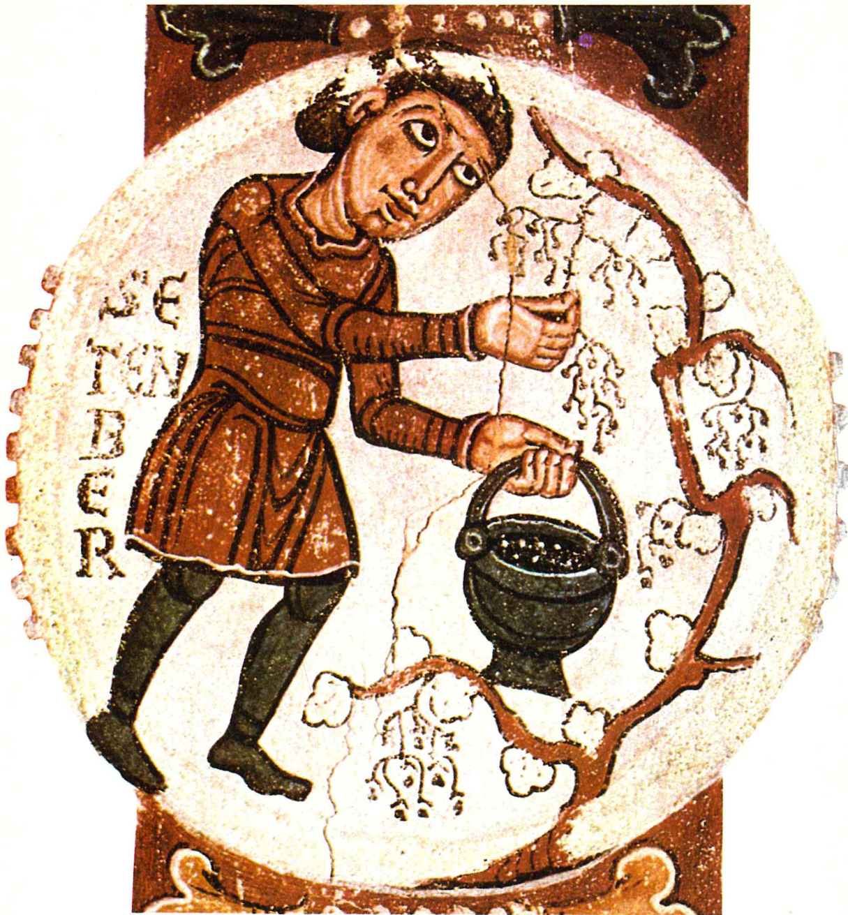
La vendimia en la Castilla del siglo XII (pintura al fresco del Panteón Real de San Isidoro de León)

la artesanía textil era parte importante de la economía ciudadana. Junto a estos artesanos se encuentran otros que se ocupan de abastecer no sólo a la población ciudadana, sino a los lugares de los alrededores, como en los siglos anteriores habían hecho los artesanos de un dominio señorial. Es en esos siglos